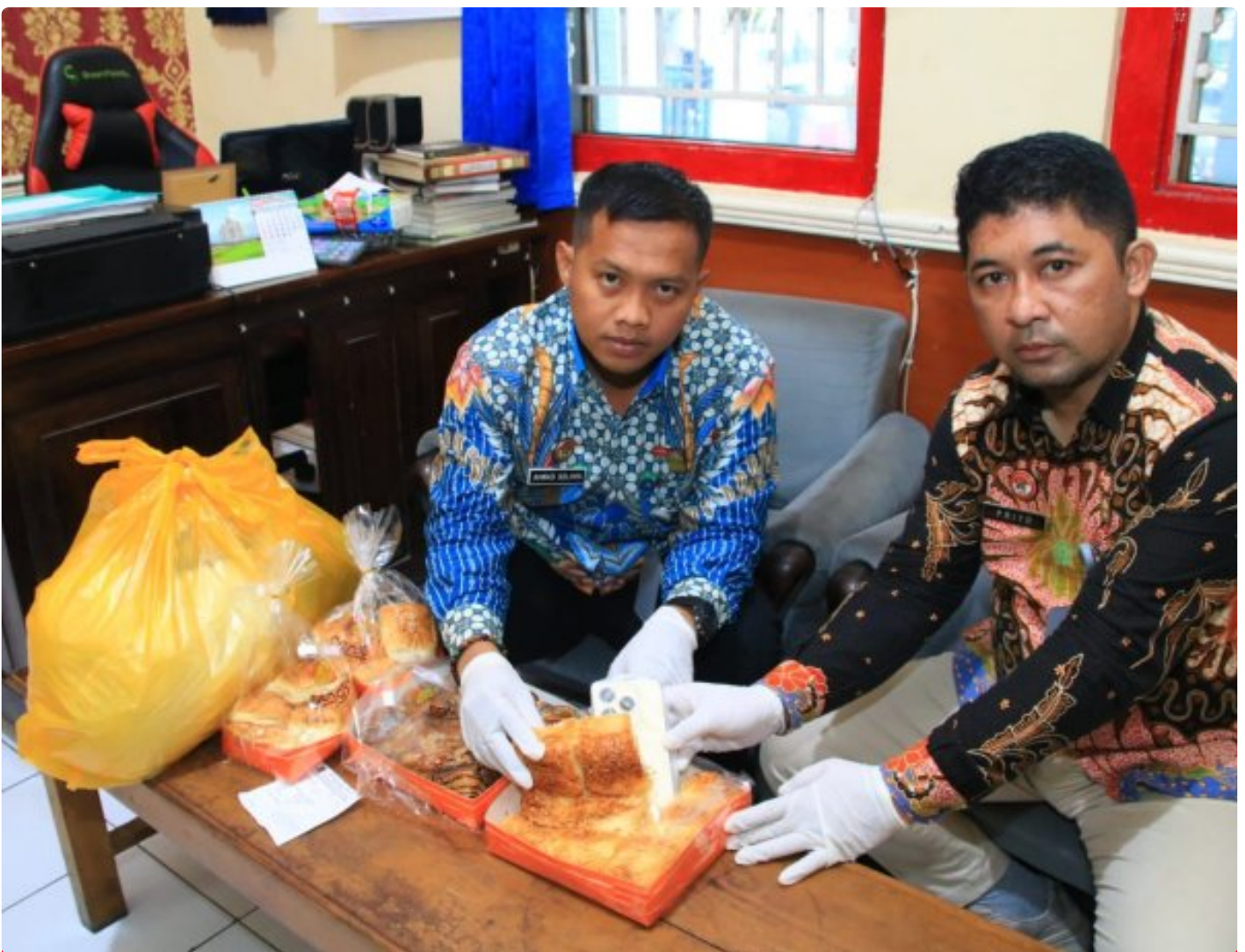
Petugas Lapas Banyuwangi berhasil menggagalkan penyelundupan HP ke dalam lapas

BANYUWANGI - Petugas Lembaga Pemasyarakatan (Lapas) Kelas IIA Banyuwangi berhasil menggagalkan upaya penyelundupan handphone ke salah satu narapidana, Sabtu (18/1/2025). Handphone itu akan diselundupkan oleh B kepada AL, seorang narapidana dengan perkara penyalahgunaan narkoba