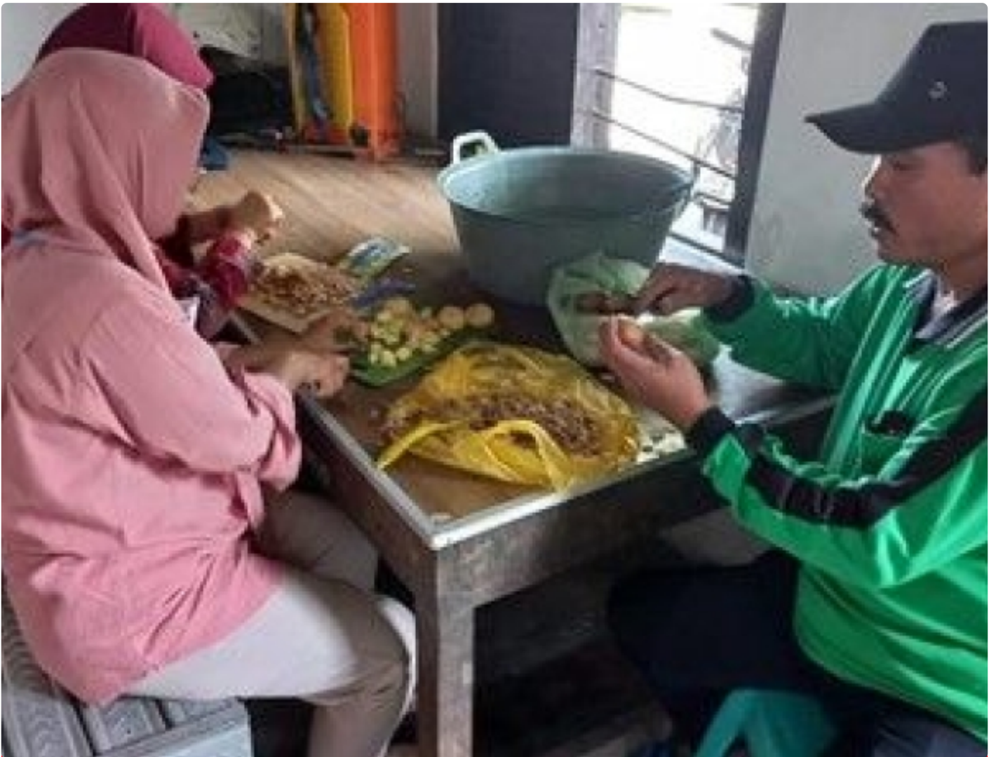
Gapoktan membantu dalam proses pembuatan media perbanyakan

BANYUWANGI - Tim Doktor Mengabdikan (DM) Universitas Brawijaya melakukan pelatihan dan bimbingan teknis pembuatan teknologi agens hayati di Desa Buluagung, Seneporejo, dan Temurejo yang terletak di Kabupaten Banyuwangi. Ketiga lokasi tersebut memiliki potensi besar sebagai desa wisata penghasil buah naga, Selasa (13/9/2022).